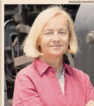
Donatella Sciuto, Rettrice del Politecnico di Milano

Che cosa vuol dire? Servono capitali pazienti e