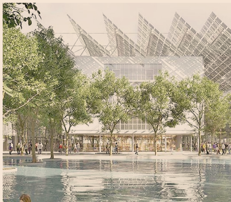
In costruzione Il Campus del Politecnico in Bovisa, progettato da Renzo Piano, all'interno del quale Tef occuperà 30mila mq

Il ceo de Angelis: «La nostra missione è sostenere la ricerca e metterla in rete con industria e mercato»